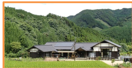
山村留学センター「星の自然の家」

山村留学に携わる指導員、地域住民、教職員、行政関係者等が、実際に山村留学を実施する現場に集まり、指導に役立つ研修や実践例を共有すると共に、留学生活に触れる事で個々のスキルアップを目指します。